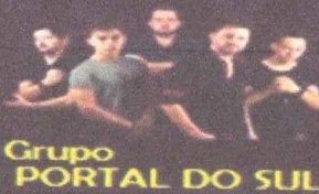
Grupo PORTAL DO SUL