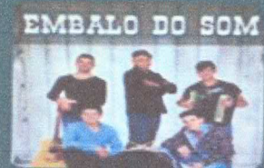
EMBALO DO SOM Embalo do Som