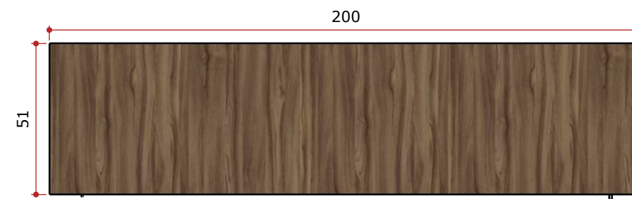
VISTA SUPERIOR - MÓVEL 01 ESCALA 1/25