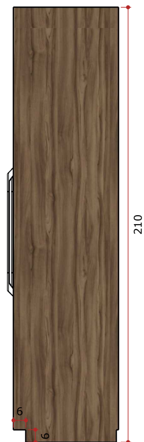
VISTA LATERAL - MÓVEL 01 ESCALA 1/25